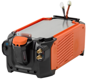
Master Cooler 05M

Kühleinheit für einfaches, schnelles und bequemes Befüllen und integrierte LED-Beleuchtung zum Ermitteln des Kühlmittelfüllstands.