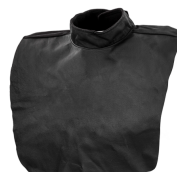
Universal leather neck protector

Vorfilter für Einheit PFU 210e PAPR. Das Paket enthält 10 Stück.