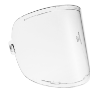
Zeta Grinding visor

Der universelle Nackenschutz aus Leder schützt Hals und Schultern vor Schweißspritzern und beim Schleifen und kann sowohl mit allen Kempki Schutzausrüstungen und als auch mit denen anderer Marken verwendet werden.