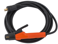
Welding cable 5 m 25 mm 2

Las pistolas Flexlite TX están diseñadas para su uso con las soldadoras TIG de Kempfi. La gama de pistolas incluye varios modelos de cuello, lo que redonda en un excelente rendimiento de refrigeración y buen acceso a diseños de juntas difíciles.