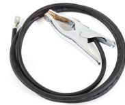
Earth return cable 25 mm 2 , 5 m