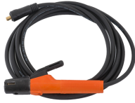
Welding cable 5 m 16 mm 2