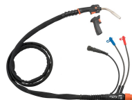
GXe 308WA (+GRe80)

300 A, raffreddamento a gas, 3,5 m o 5 m, connettore Euro con Amphenol