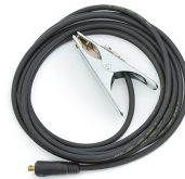
Earth return cable 5 m, 16 mm 2