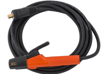
Welding cable 5 m 25 mm 2