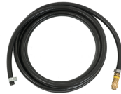
Shielding gas hose 4.5 m