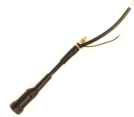
Euro Adapter for MinarcMig

En euroadapter for MinarcMig gir langt flere tilkoblingsmuligheter.