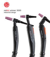
Flexlite TX - Master M

Chłodnica umożliwia łatwe, szybkie i wygodne napełnianie płynem chłodzącym dzięki wbudowanemu oświetleniu LED, które wskazuje poziomy napełnienia.