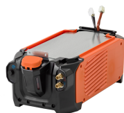
Master Cooler 05M

Flexlite GXe to seria niezawodnych uchwytów spawalniczych MIG/MAG o wysokiej jakości, zoptymalizowanej ergonomii i doskonałych parametrach spawania.