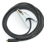
Earth return cable 5 m, 16 mm 2