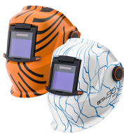
Beta Art e90A

Сварочная маска Beta e90X с автоматически затемняющимся сварочным светофильтром XA 47 обеспечивает надежную защиту глаз, лица и шеи при выполнении основных операций сварки и изготовления. Эта модель имеет легкую, но прочную конструкцию корпуса. Сварочная маска Beta e90X включает удобный головной бандаж, функцию GapView и рамку для увеличительной линзы.