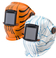
Beta Art e90P

Специальная версия популярных сварочных масок Beta серии e. Выберите один из двух уникальных вариантов дизайна: «Лес» отображает детали красивой северной сосны, а «Лед» – неповторимые детали морозного скандинавского пейзажа. Модель e90A имеет систему защиты глаз SA 60B с автоматическим затемнением, а также прочный и легкий корпус. Данная маска предлагает также удобный головной бандаж, функцию GapView откидной линзы и оправу для увеличительных линз.