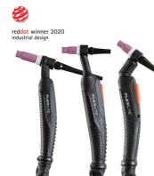
Flexlite TX - Master M

Блок охлаждения для простого, быстрого и удобного заполнения охлаждающей жидкостью со встроенной светодиодной подсветкой для контроля уровня.