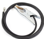
Earth return cable 25 mm 2 , 5 m