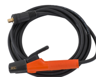
Welding cable 5 m 25 mm 2

160 А с газовым охлаждением, газовый клапан, DIX 9 мм, 4 м, большой наконечник горелки