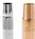
MIG/MAG gas nozzles

Pistolhalsen leder den elektriska strömmen till kontaktmunstycket tillsammans med skyddsgasen och kylvätskan. Du kan förlänga svetspistolens livslängd genom att byta ut dess hals.