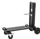
X3 4-wheel Trolley

适用于 GXe 5 系列焊枪的经典模拟遥控器，可用于储存通道或送丝调整。新形状重量轻、耐用，并且可在佩戴焊接手套时轻松操作。通道台阶卡扣可以用小螺丝刀进行调节和拆除。塑料更加坚固，橙色电位计的固定也得到了改进。与支持遥控器的 Kemppi 焊接兼容。